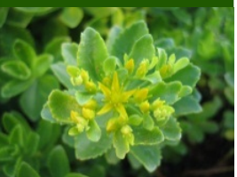
常緑キリンソウ袋方式