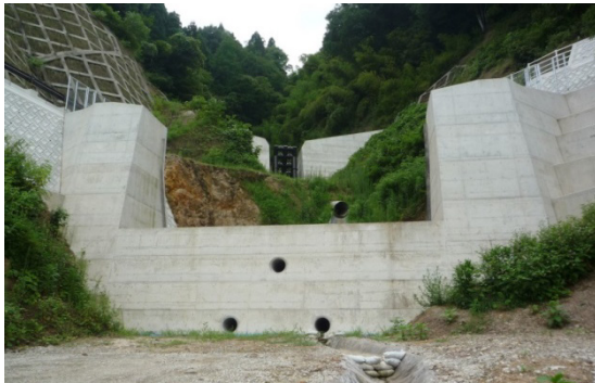
コンクリート巨大物が緑化され景観に配慮した物に生まれ変わる

暑さ、寒さ、雪、乾燥、湿潤に強い「常緑キリンソウ」と土壌を袋に入れ、「土壌流防」「雑草対策」「簡単緑化」を実現した新しい緑化方式(FTM バッグ)です。標準寸法は 50cm 角で、1 m 2 の荷重は 40kg と軽量なため、様々な場所で使用されています。壁面緑化や折板屋根の緑化では、20cm ~40cm×100cm のサイズを使用します。袋は、型を持たないので、現場に合わせた寸法のオーダーが可能です。