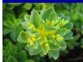
常緑キリンソウ袋方式

専用土壌が入ったファスナー式の袋(雑草対策)に常緑キリンソウを植栽し、袋を並べるだけで緑化が完成。散水の必要がなく、刈込不要の画期的な緑化システム。