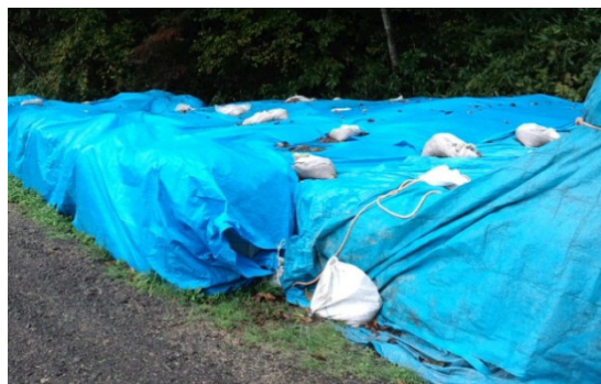
ブルーシートを掛けた状態で放置される汚染土壌の仮置き場

暑さ、寒さ、雪、乾燥、湿潤に強い常緑キリンソウを用いた緑化システムです。ブルーシートを掛けた状態で放置された汚染土壌の仮置き場。見た目も悪く、飛散防止の土嚢もすぐに破れ、雑草が侵入してきます。この緑化システムは、精神的な不安感の解消と中間貯蔵施設の緑化に再利用する事をコンセプトとしています。常緑キリンソウは、芝や稲科植物と違ってセシウムをほとんど吸収しません。