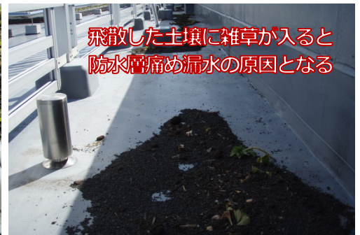
飛散した土壌に雑草が入ると防水層痛め漏水の原因となる