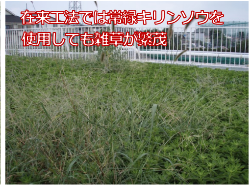
在来工法では常緑キリンソウを使用しても雑草が繁茂