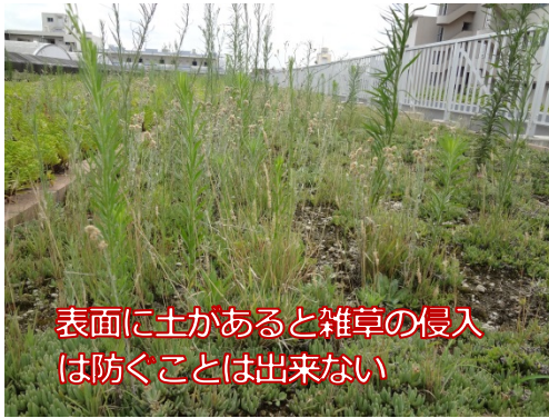
表面に土があると雑草の侵入は防ぐことは出来ない