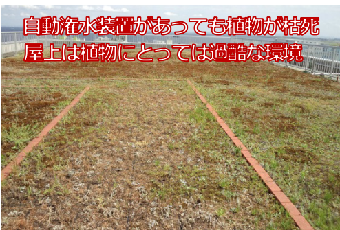
自動灌水装置があっても植物が枯死 屋上は植物にとっては過酷な環境