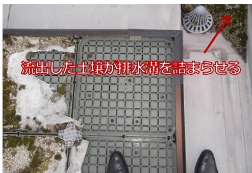
流出した土壌が排水溝を詰まらせる