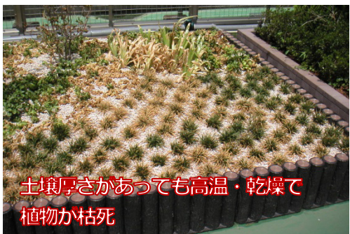
土壌厚さがあっても高温・乾燥で植物が枯死