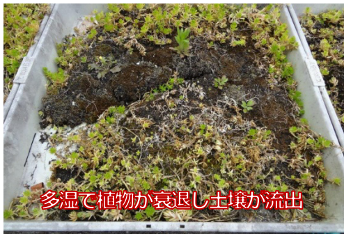
多温で植物が衰退し土壌が流出