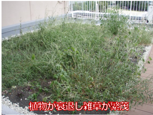
植物が衰退し雑草が繁茂