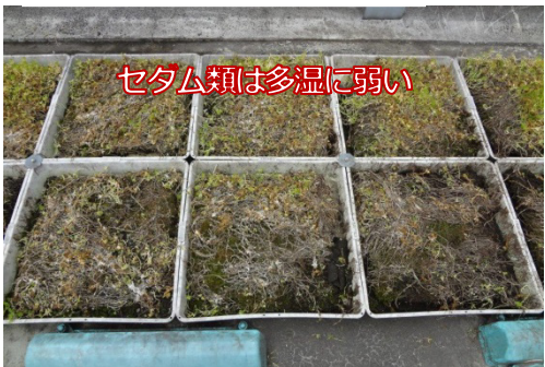
セタム類は多温に弱い