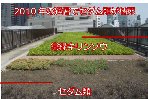
2010年の猛暑でセタム類が枯死