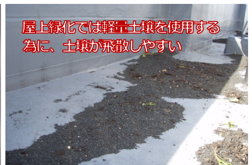
屋上緑化では軽土を使用する為に、土壌が飛散しやすい