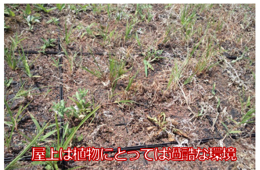
屋上は植物にとっては過酷な環境