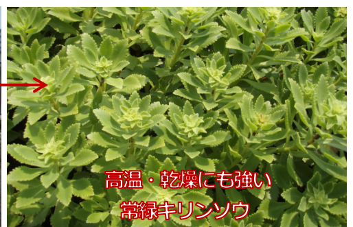
高温・乾燥にも強い 常緑キリンソウ